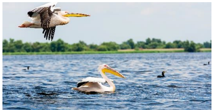
Pelikane im Donaudelta