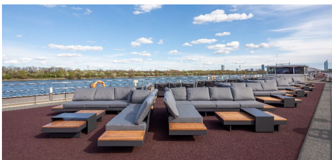
MS Nestroy, Lounge Sonnendeck