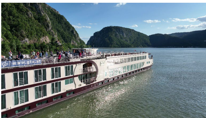
MS Nestroy im Eisernen Tor