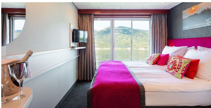
MS Nestroy, Doppelkabine Schiller- / Goethedeck